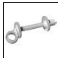
Tornillo para Asiento Inodoro