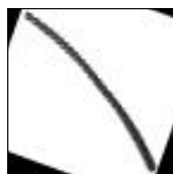
Sello de Goma