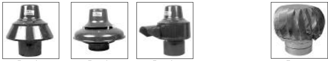
Forzador Tiro Corto Forzador Parrillero Forzador Direccional Extractor Eólico