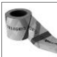
Kg. Cinta Peligro