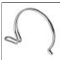
Grampa p/PP y PVC