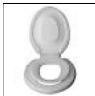
Asiento para Inodoro Familiar