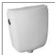
Depósito Mochila Wada