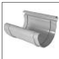
Unión para Canaleta