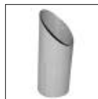
Tubo 3 mts.