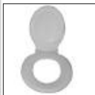
Asiento para Inodoro