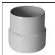
Acople de Tubo