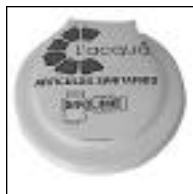
Depósito Mochila L'acqua