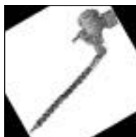
Flotante p/ Depós. RH sin Boya