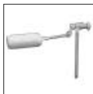
Flotante para Depósito Mochila