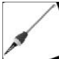
Lluvia Plástica c/ Cromo