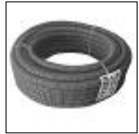
Rollo X 25 Mts.