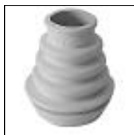
Conexión Fuelle Inodoro