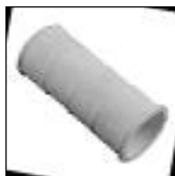
Conexión Depósito Exterior