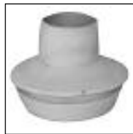
Conexión Común Inodoro PVC