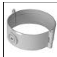
Abrazadera para Tubo