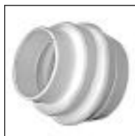
Conexión Depósito Mochila