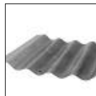
Chapa Acanalada Verde

Código Med. 461 1,10 x 6p 1,83 462 1,10 x 7p 2,13 463 1,10 x 8p 2,44 464 1,10 x 9p 2,75 465 1,10 x 10p 3,05 466 1,10 x 11p 3,36 467 1,10 x 12p 3,66 468 1,10 x 13p 3,96 469 1,10 x 14p 4,25 470 1,10 x 15p 4,56 471 1,20 x 2,00 lisa 886 1,10 x 21 pie