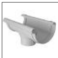
Embudo para Canaleta