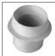
Conexión Depósito Trafal