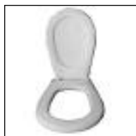
Asiento para Inodoro Pilar