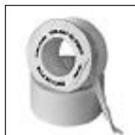
Cinta PTFE Dupont

Código Med. Emb 431 1/2 x 10 mts. 200 432 3/4 x 10 mts. 200 433 1 x 10 mts. 100 436 1/2 x 20 mts. 200 437 3/4 x 20 mts. 200 438 1 x 20 mts. 100