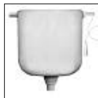
Depósito a Cadena