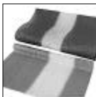
Rollo Color 4,20 mts.