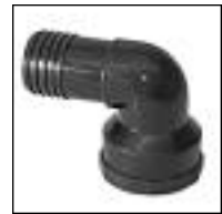
Codo Enchufe y Rosca