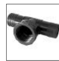
Tee Enchufe y Rosca