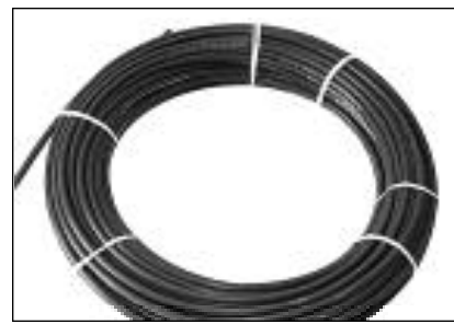
Caño de Polietileno Rollo de 100 mts