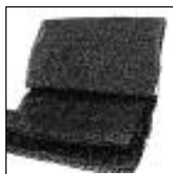
Rollo Negra 4,20 mts.