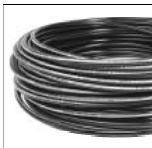
Caño Polietileno Rollo de 100 mts