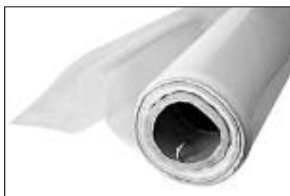
Rollo Film Polietileno Cristal