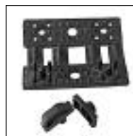
Broches para Media Sombra