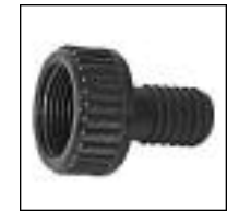
Enchufe RH Reducción