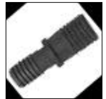
Enchufe Doble Reducción