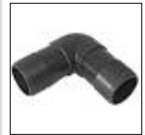
Codo Doble Enchufe