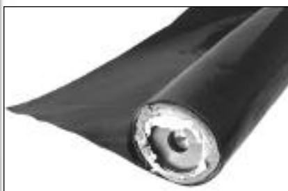
Rollo Film Polietileno Negro