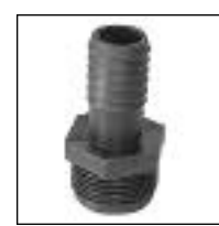
Enchufe RM Reducción