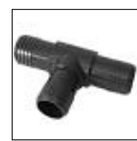
Tee Triple Enchufe