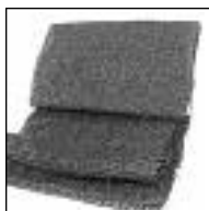
Rollo Verde y Negro