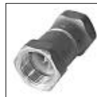
Válvula Retención Bronce

Código 1863 1864 1865 1866 1867 ø mm 3/4 1 1 1/4 1 1/2 2