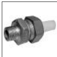
Ferula de Bronce