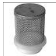
Filtro para Válvula Retención Bronce

Código 1863 1864 1865 1866 1867 ø mm 3/4 1 1 1/4 1 1/2 2