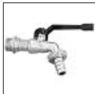
Canilla Esférica Bronce (China)

Código 1850/N 1851/N 1858/N ø mm 1/2 3/4 1