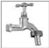
Canilla Bronce para Manga