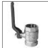
Válvula Esférica Italy Bronce (importada)

Código 1841 1842 1843 1844 1845 1846 1847 1848 1849 ø mm 1/2 3/4 1 1 1/4 1 1/2 2 2 1/4 3 4