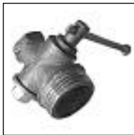
Llave Limpieza Tqe Bronce