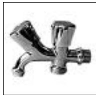
Canilla para Lavarropa