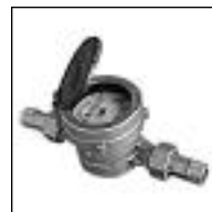
Medidor con cuerpo de Bronce

Código 1881 1882 Descrip. 1/2 3 m 3 t/m - c/s 1/2 3 m 3 t/m - c/h