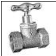
Llave de Paso Bronce