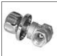
Válvula Esférica p/ Empotrar

Código 1841/N 1842/N 1843/N ø mm 1/2 3/4 1