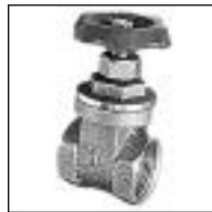
Válvula Esclusa Bronce JM

Código 1870 1871 1872 1873 1874 1875 1876 1877 1878 ø mm 1/2 3/4 1 1 1/4 1 1/2 2 2 1/2 3 4