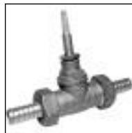
Llave Maestra OSN Bronce