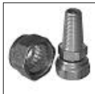
Empalme Cónico p/ Plomo