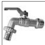
Canilla Esférica Italy Bronce (importada)

Código 1841 1842 1843 1844 1845 1846 1847 1848 1849 ø mm 1/2 3/4 1 1 1/4 1 1/2 2 2 1/4 3 4