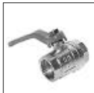
Válvula Esférica Bronce (China)

Código 1850/N 1851/N 1858/N ø mm 1/2 3/4 1